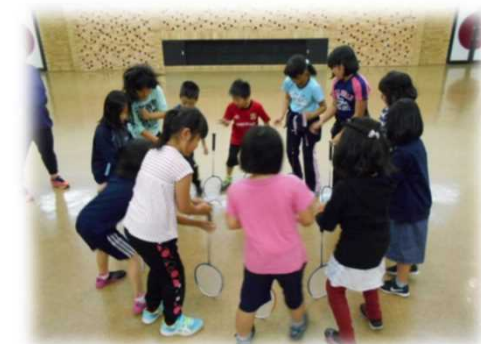
(バドミントン教室 ～スポーツチャレンジ～)