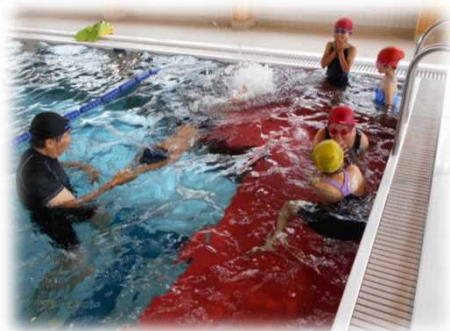
(夏休みの水泳教室 ～スポーツチャレンジ～)

長期休業中に子供たちの規則正しい生活習慣の定着のため、地域の教育力を活用し、午前中のスポーツチャレンジや学習活動を行っている。季節に合った活動を工夫し、活動後、放課後子供教室の指導員による学習支援活動も行っている。