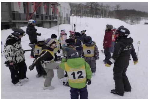
スキー教室の指導員として子供たち（学校行事）をサポートしているボランティア

○ボランティアの方の若返りを図りたいと願いを共有したところ、クラブ活動にかかわってくださる保護者の方が、一緒に活動したいと申し出てくださった。今後はさらに増やしていきたい。