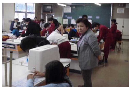
家庭科のミシン学習で職員を補助するボランティア（教科学習支援）