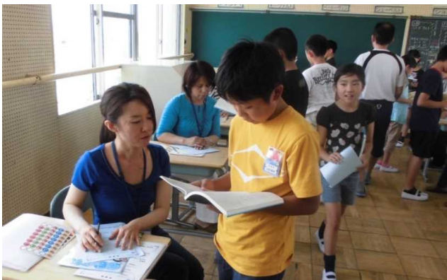
援読学 習サ ポ ー タ ー と と も に 「 音 読 ・ 脳 ト レ ラ ン ド 」 ( 学 習 支 援

学校運営協議会では、全体会・各部会ともに、委員一人一人が当事者意識をもって、本音で話し合っている。どんな子供に育てたいかをとことん熟議することで、明確な教育ビジョンを共有し、ベクトルを揃えて地域学校協働活動を実施している。