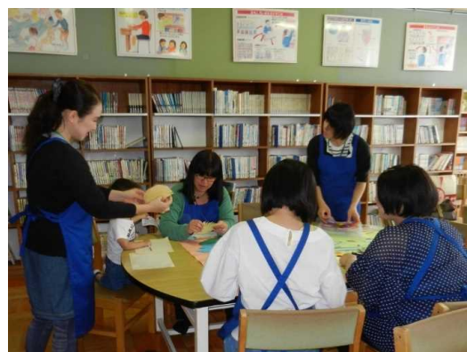
備の「 ト シ ヨ ボ ン 」 に よ る 週 一 回 の 図 書 館 整 備 活 動 ( 環 境 整 備