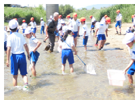
近隣の川の水を観察し、生物探し（3年総り合）