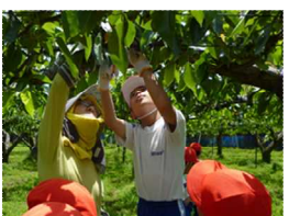
梨園で梨の収穫（3年総り合） わくわくファームで（5年総り合）