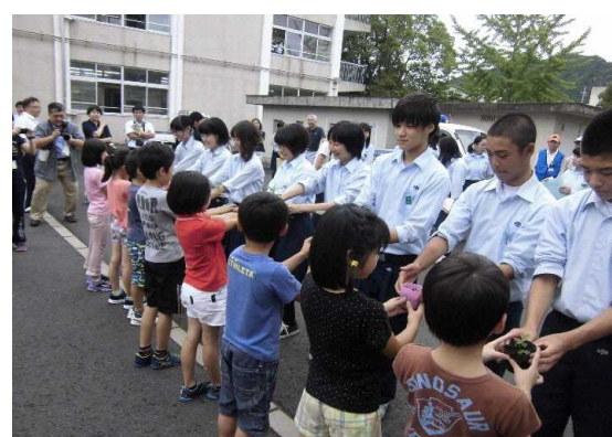
校区小学校へのフジバカマの贈呈式