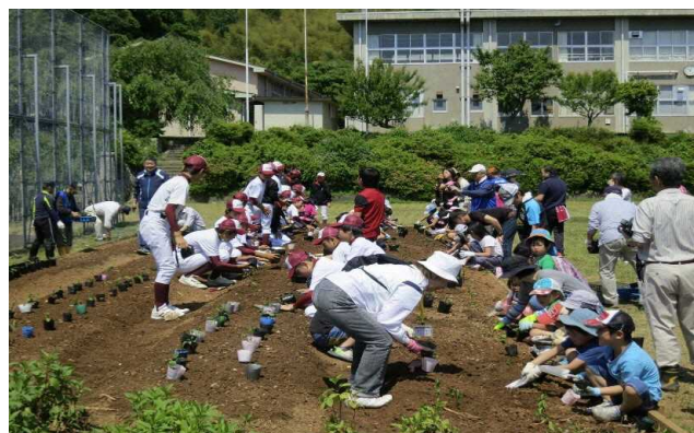
小中合同でのフジバカマの植栽（旧青井小学校）

旧青井小学校で、9月に地域の方が講師となり、校区の小学3年生が合同で『こん虫のかんさつ』の学習をしている。今年11月、学習の際にマーキングした蝶が、948km離れた鹿児島県喜界島で捕獲され、ロマンある取組に発展し、校区は大いに盛り上がっている。