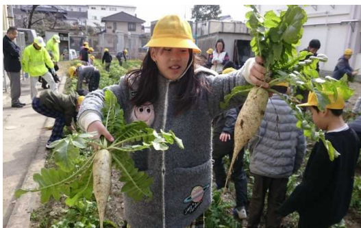
(佐山小学校青少年健全育成協議会)

まなび塾、校区青少年健全育成協議会、学校運営協議会等をはじめとした地域の団体・関係者の連携・協働により、子供たちのための体験活動機会の充実や見守り活動をととした安心・安全の確保など、具体的な活動が進んできている。