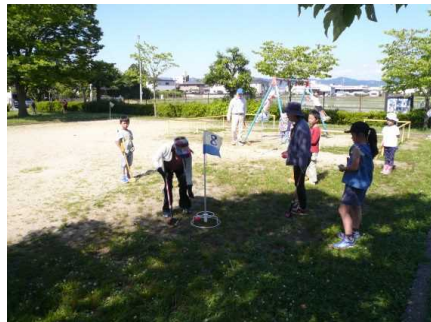
佐山まなび塾ランドゴルフ大会