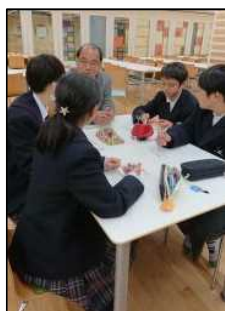
キッズランド(7年生の活動の様子)(左)(中)