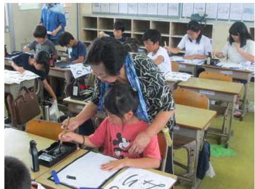
(学力向上部会) 習字講座