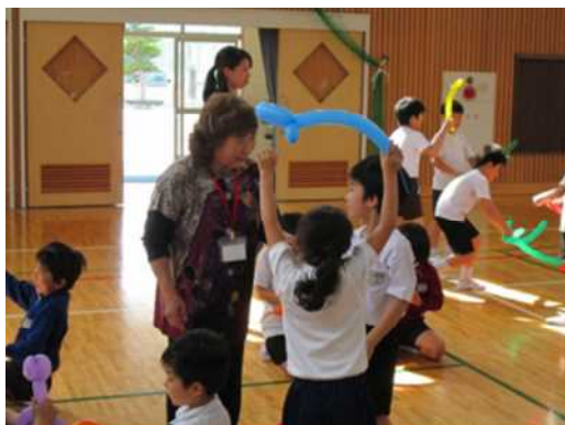
(放課後子供教室) 豊かな心部会

家庭科授業でのミシンの支援や阿波踊り・水泳・陸上練習等の指導と、幅広く学校の教育活動の支援をしてもらっている。また、三庄ミニギャラリーのコーナーを設け、地域の方の書道・俳句等の作品を展示し、地域の文化活動との連携を図るとともに、来校の機会を増やしている。