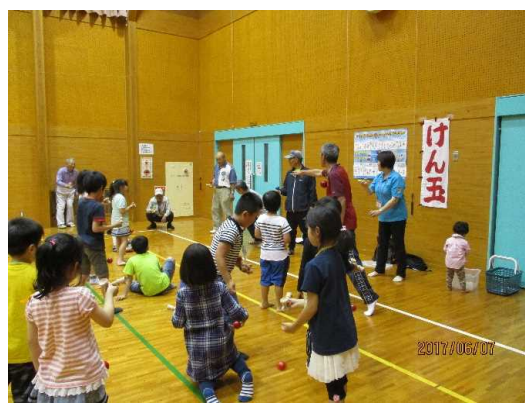
地域住民と一緒にけん玉(泉川っ子体験教室)