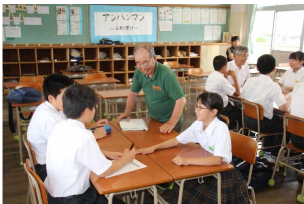
生徒会と地域住民で構成された「まちづくり専門委員会」での熟議

小学生の放課後の居場所づくりとして、公民館・各種団体・地域ボランティア等と一緒に「泉川っ子体験教室」を実施している。また、平日の放課後は「放課後まなび塾」を開催し、地域の教員OB等が児童の自主学習のサポートを行っている。