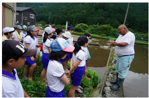
米地域の方々から体験を通して

○地域の方とのふれあい活動が多彩である。中でもPTAと地域・児童が一体となった地域行事への参画が多く、「せんだんまつり」の開催や自然体験学習で栽培収穫した野菜やお米を使って「感謝祭」を開催し、お世話になった地域の方々を招いてごちそうするなど地域に根付いた行事を行っている。また、県指定無形文化財にも指定されている「葉山村花取踊り」や町内久保川地区における「御伊勢踊り」などにも児童自らが積極的に参加し、伝統的文化の継承に繋がっている。