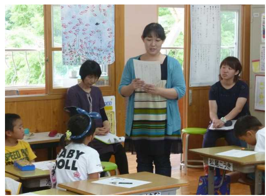
授業への参画 地域・保護者の方による道徳