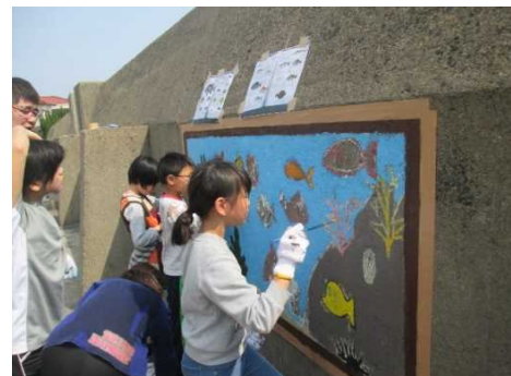
「野外アート教室」 2年以上前に描かれた