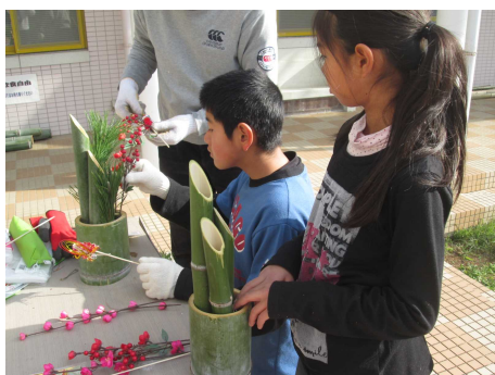
「野外アート教室」 実際に子供たちが竹を

平成29年度は初めての試みとして、護岸壁に描かれた壁画の修復を目的とした「野外アート教室」、また「ながさき土曜学習応援団」を活用し、町外から講師を招いて「科学実験教室」を開催した。