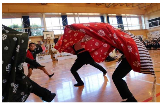
をの地舞う統の子文人供たである出田のい獅、子地域舞

ふるさとを愛する心やコミュニケーション能力を育むために、教科横断的な学習として、総合的な学習や土曜授業で地域の方と一緒に活動している。