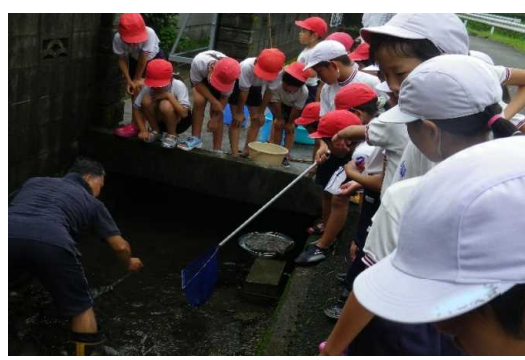
ナ虫地のにの域のえ観の方と察さやや幼校を虫区の小子さ川供のた力蛍ちワの二幼