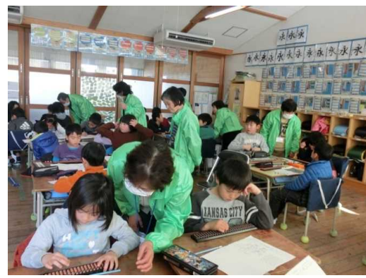
そろばん授業の指導・支援