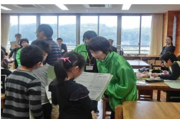
理科の授業での傾聴ボランティアの様子

年度末に一年間お世話になったボランティアの方に集まっていたで、「ボランティアの集い」を開催している。学年ごとに、ボランティアの方への御礼の手紙渡しや合唱等の発表等を通して、地域との交流を深めている。