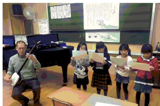
男鹿発祥の民謡「秋田船方節」を（放課後子ども教室）