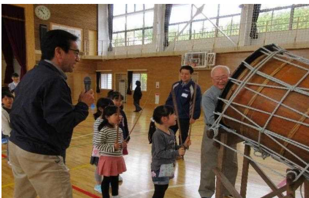
盆踊り体験「ダダダゴ」で運動会で披露するぞ！