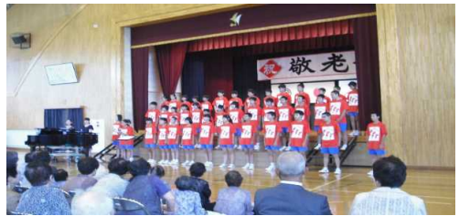
敬老会でのダンス披露・湊中