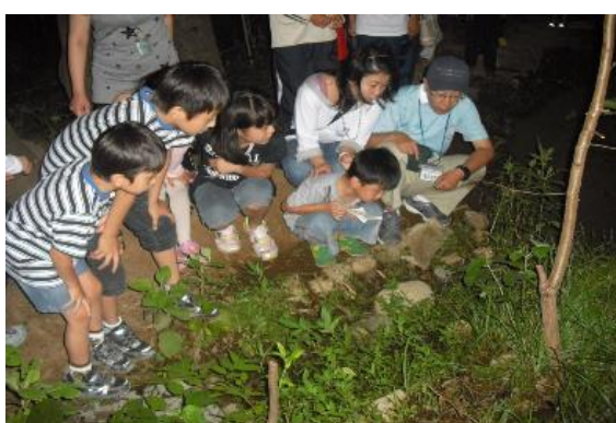
「ホタルの幼虫の飼育」は一部を児童の家庭に委託している

フェイスブックも活用した支援本部ホームページを開設し、写真を多用して諸活動の実施状況を広く発信することで地域の理解・協力を促進しています。