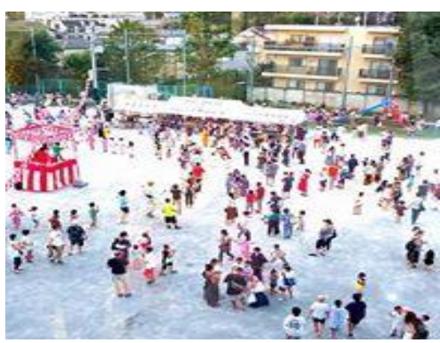
「方南ぼんおどり」は地域の伝統を伝える行事として定着