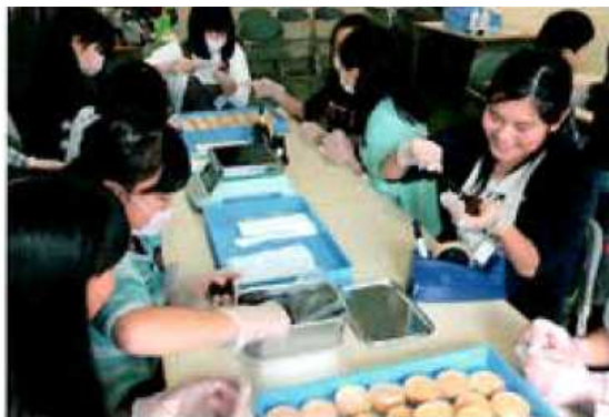
和菓子づくり実習 「校外学習」

子ども未来塾の課外授業として、英語に慣れることを目的としたKid's Englishを 毎週金曜日で年間33回を開催している。