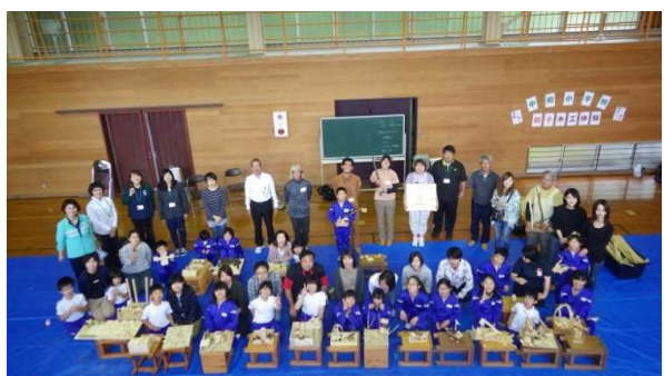
が親子木工体験教室（全校児童が親子で参加）