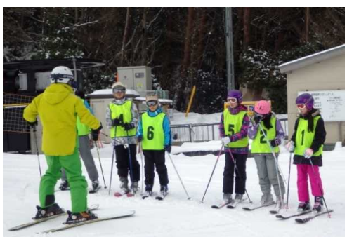
のスキー教室（全校児童がGT指導により上達！）