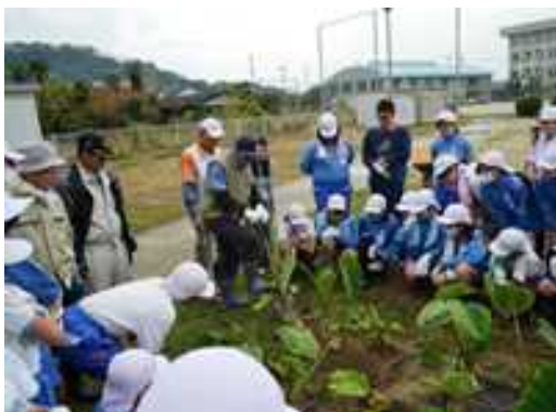
種々の農作物の植えつけから収穫までの体験（授業補助）

放課後の子どもの居場所づくりとして、教員OBや生涯学習グループ、各種団体が一緒になって「垣生放課後まなび塾」、「垣生校区放課後子ども教室」を開催している。月・水・金曜日は学習支援、隔週水曜日に、卓球・軽スポーツ・調理など多様な体験活動を計画している。