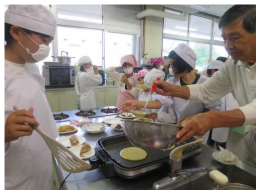
地域住民と一緒に放課後子ども教室でパンケーキ作り