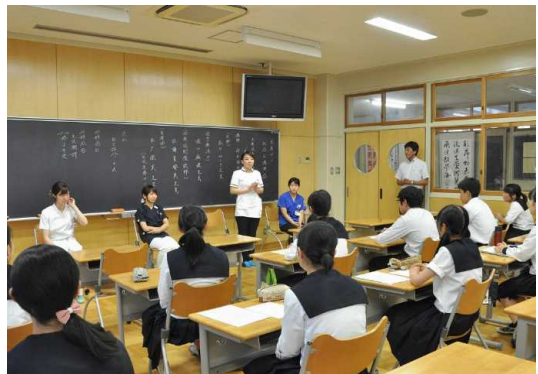
埼玉協同病院と連携した医療セミナーの皆さまによる講演会