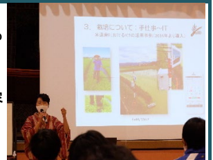
社会人に話を聞く会

中学1年生を対象に実施した「社会人に聞く会」は、働くことの意義や職業観について学ぶ機会となっている。2年前より学校運営協議会との共催となり、講師選定や依頼も容易になった。この他にも小学校「職場調べ」や中学校「職場体験」など、多くの大人がそれぞれの立場でキャリア教育に関わっている。