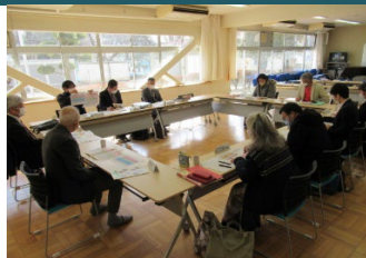
熟議「キャリアアッププラン」

「ぼらりす」では、一貫校の目指す子ども像の実現のために、協議会委員がそれぞれの立場で、児童生徒・保護者・地域の声を細かく聞き取りながら熟議を重ねている。その成果として「キャリアアッププラン」ができた。このプランの具体的な行動目標や効果的な周知方法など検討を重ねている。