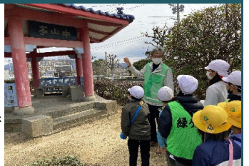
「ふるさとウォーク」で地域の方から史跡の説明を聞く子供たち

1 地域との連携のもとオール・ブリュット展を開催した。 2 地域行事のみどりまつりで準備から撤去まで地域の方と一緒にいった。 3 学校行事のふるさとウォークでは、地域や保護者に見守り活動や史跡説明、児童と一緒に史跡巡りなどをし、参加してもらった。