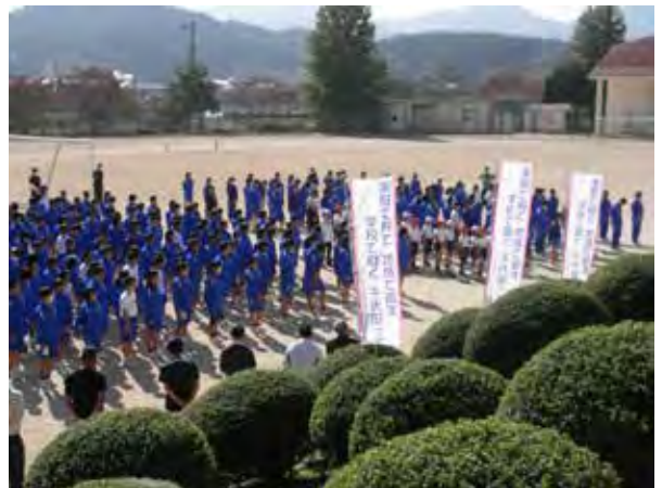
一斉ボランティア清掃活動

活動に当たっては本協議会のスローガン「家庭で育て 地域で鍛え 学校で磨く」の入った幟旗（各学校3本ずつ所有）を立てて、雰囲気の高揚を図っている。また、スタッフ用のベストも作成し自覚と責任を促している。上記で挙げた活動のうち②の事業は、当初は組織の強化、地域・保護者啓発に重きを置き、大学教授による子育て講演会、地域・保護者・学校関係者によるパネルディスカッションなどを行っていたが、各学校の代表児童生徒による「主張」の内容に加え、一昨年度からは、学校間の連携・協働、学校と地域の連携・協働を更に深めるために「千代田っ子フェスティバル」とイベント名を変え、児童会や生徒会も企画に関わり、各学校の児童生徒が自校の取組を様々な形で千代田地域全体に発表し、最後に参加者全員で合唱するなど、地域の状況や児童生徒の状況に対応した内容へと変えていくよう工夫しながら取り組んでいる。