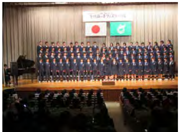
千代田っ子フェスティバル

読み聞かせ・図書室のポップづくり・花田植え・太鼓・花笠踊り・昔遊び・大豆等野菜や米づくり 地域の仕事見学・職業学習：例えば石材店・警察・薬剤師・看護師など