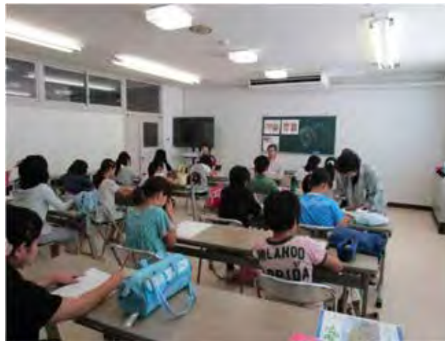
(絵画教室) 人物画のデッサン