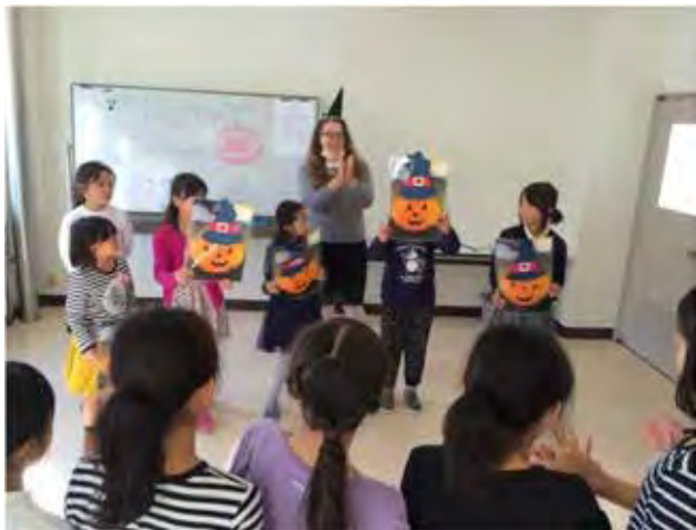
(英語教室) アメリカの文化を学ぶ