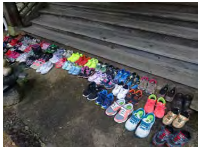
何も言わずきちんと並べる子供たちの靴

スタッフや講師が本物のボランティア精神で子供たちと楽しみながら続けていることが、これまでの継続力に繋がったのだと思われる。