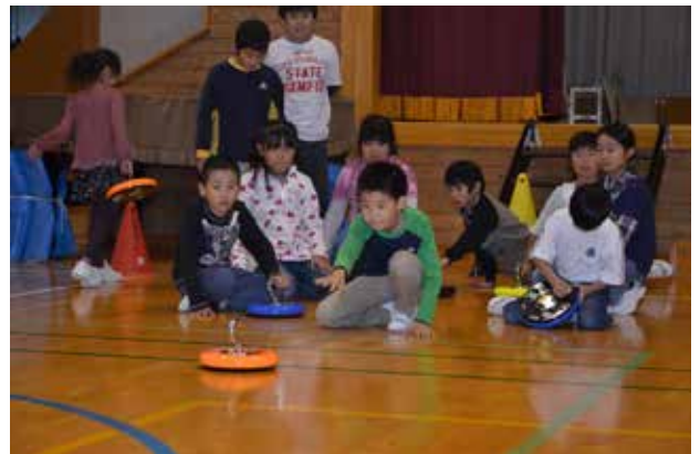
ニュースポーツ（カラーリング）