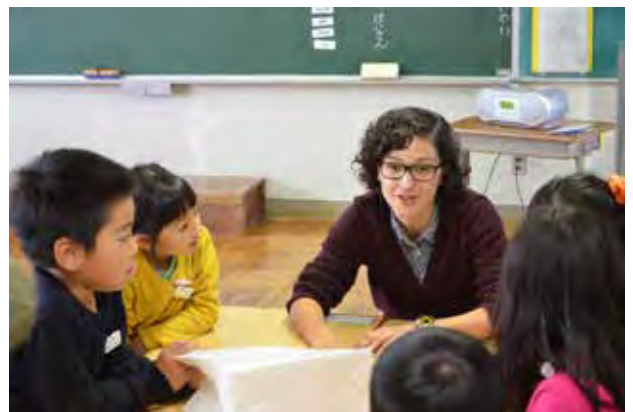
ALTによる英会話教室