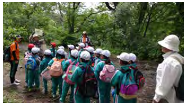
さくら小学校自然体験教室 1・2年生 （五色沼自然探勝路）