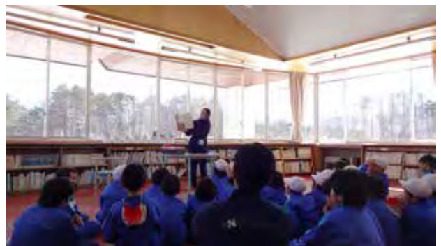
裏磐梯小学校 月に一度の読み聞かせ 全校生徒が参加します

（NPO・企業と連携）民間の「もくもく自然塾」、「磐梯山ジオパーク協議会」と連携し、小学生の自然体験活動のガイド等をお願いした。（学習支援）理科の昆虫講師（ジオパーク協議会等）、社会の地域の地理・歴史講師（地域の各団体）、英語の英会話講師（元英語教師住民）