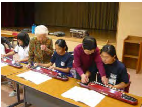
玉井子ども教室 (大正琴体験)