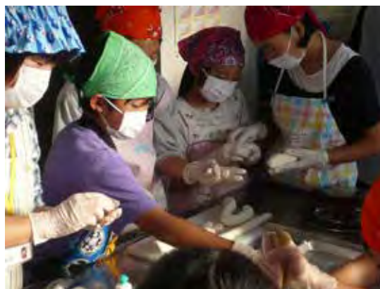
大山子ども教室 (豆腐入り団子作り)