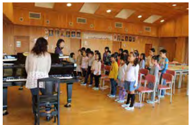
「合唱・音楽」活動の様子