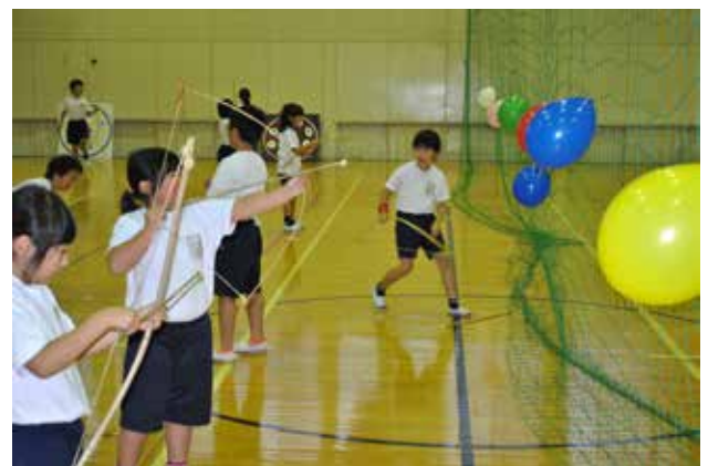
昔遊び「弓矢を作って遊ぼう」