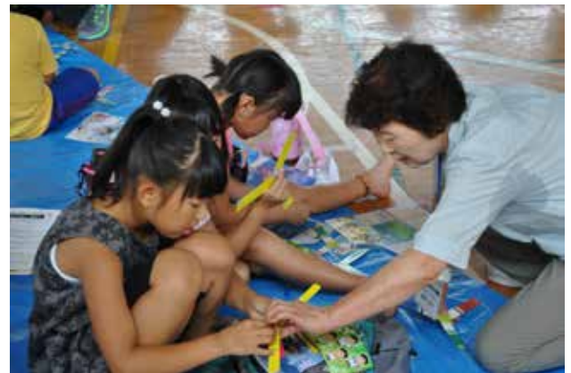
「ブーメランを作って遊ぼう」