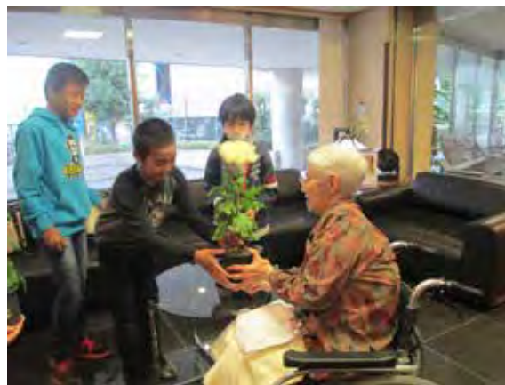
民生委員と介護老人保健施設の皆さんへ菊をお届けします。

放課後子供教室・・・NPO団体「府中YSS」スクール・コミュニティとの共催事業「ラジオ体操」「肝試し」「読み聞かせ」等