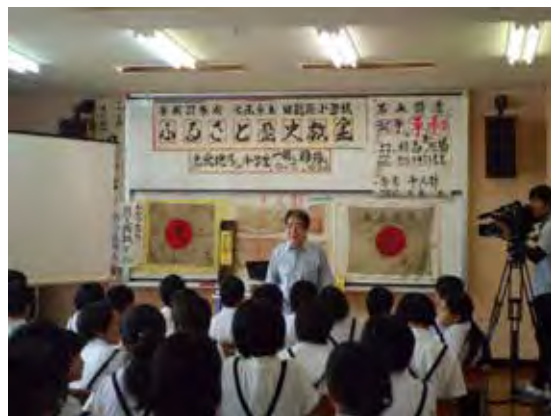
戦争と平和を考える講座