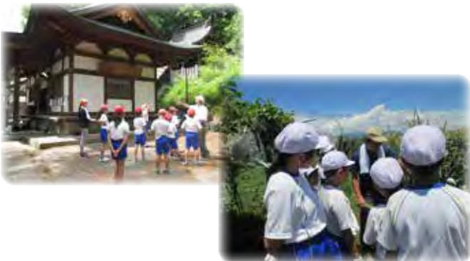
中道ふるさとハイキングの様子

「放課後学習教室」は、活動内容の選択肢を広げるため、「放課後子供教室」として展開を始めている。