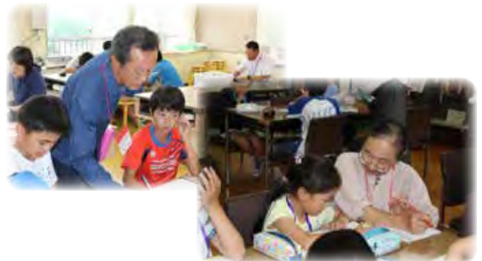
地域教員OB協力の「放課後学習教室」