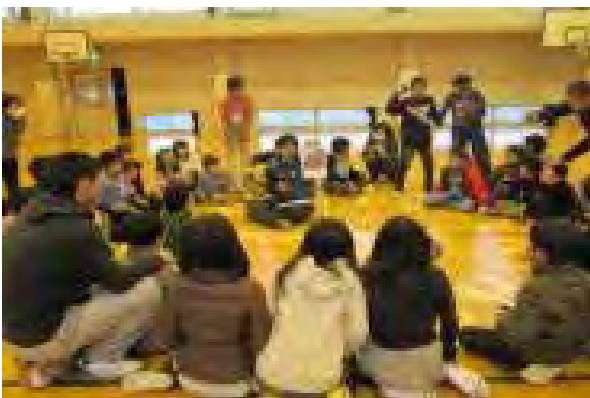
学生と一緒にネイチャーゲーム