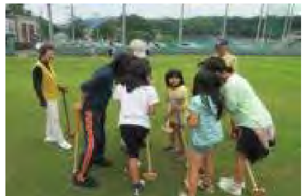
地域の老人会とのグラウンドゴルフ