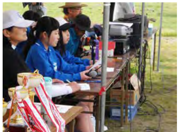
地区体育会には中学生が係員として活躍

地域の民生委員や「NPO法人子どもたちの環境を考えるひこうせん」と連携・協働して、地域の乳幼児をもつ保護者と乳幼児を招いた「赤ちゃん登校日」を実施している。