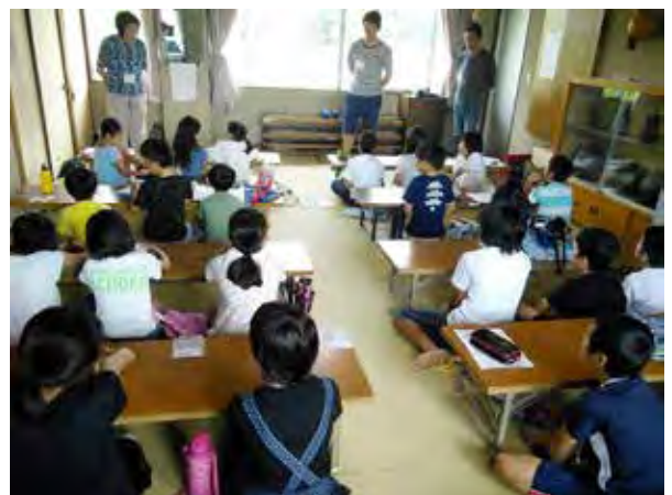
週末は「備前まなび塾+」で地域の方が小中学生に学習支援