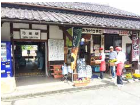
アンテナショップ 「野の花ショップ 夢元」 （接遇と駅の清掃）