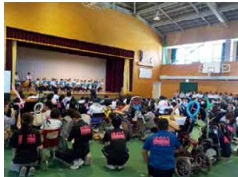
「地域との交流会」百名を超すボランティアと共に開会式（久米南中学校吹奏楽部演奏）