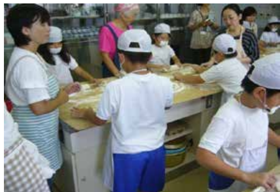
みんなで楽しくうどんづくり