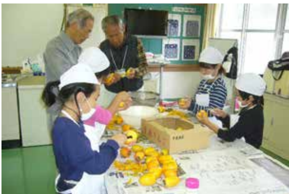
干し柿づくり・真剣に皮むき

ボランティアといえども、専門家である。教えて頂くことは、教職員にとってもよい学びの機会になっていた。子供たちにとっては、教室では学べない刺激のある機会となっていた。1月に行われる生活科・総合的な学習の発表会「だんのうら学習発表会」では、お世話になった地域の方々を招待し、学んだことを発表しているが、同時に感謝の言葉を伝えるよい機会ともなっている。また、芝生や木々の剪定等、整えられた環境のもとで、子供たちは心身ともに、よりよく成長している。そのような子供たちを見つめながら、地域ボランティアの方は、「子供たちの喜ぶ顔を見るのが嬉しい。」とつぶやいておられた。