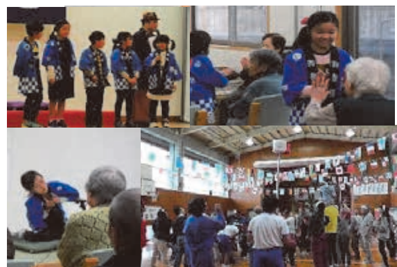
地域参画（町・地域行事の活性化、地域に笑いを届ける）