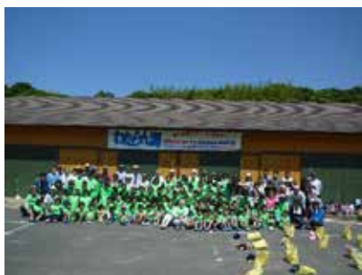
ツインズビーチ海岸清掃