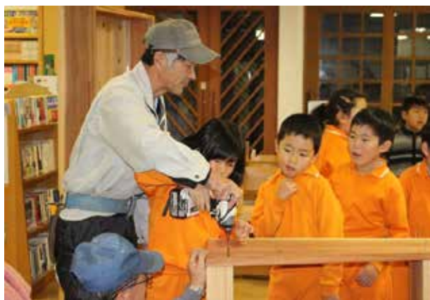
「本棚作り」 企業の方を講師に招いて