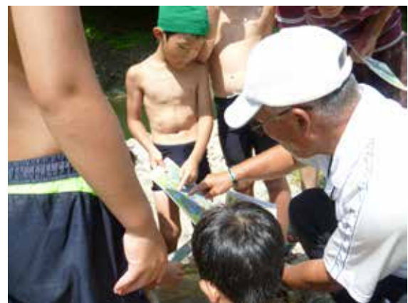
「川の生き物の調べ」 専門家を講師に招いて