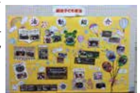
生涯学習フェスティバル出品