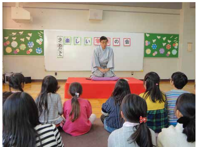
落語のお楽しみ会