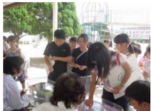
「夏休みお楽しみ会」のようす