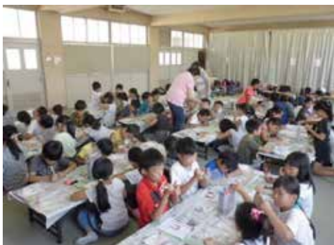
「夏休み手作り教室」のようす お化けちょうちんを作った