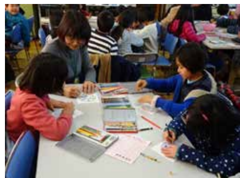
活動例 (まんだらめりえ)