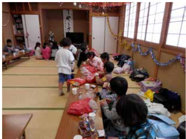
「クリスマス会」お菓子をもち寄ってパーティー