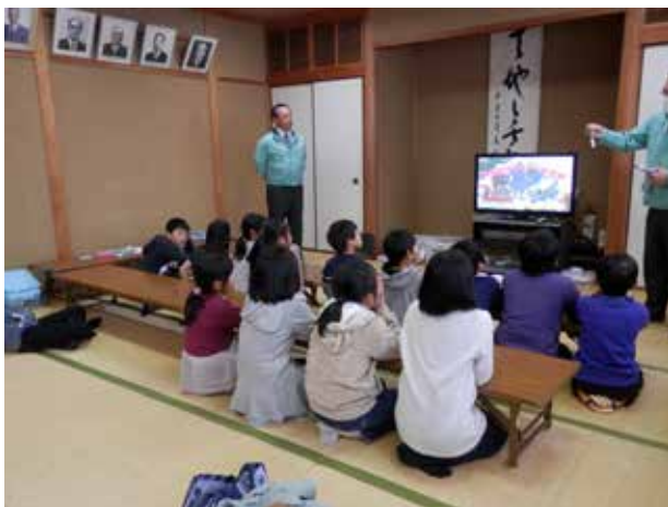
「よんでんエネルギー講座」真剣に学習中

子供たちの間では、些細なことで口論となることなどもありますが、サポーターはできる限り子供たち自身での「気づき」を尊重するよう心掛け、状況に応じて仲裁に入るか否かを判断している。その結果、現在では子供たちが学校外の活動を通して、上級生が下級生に宿題を教えたり、遊び方をレクチャーしたりする光景が多く見られるようになってきている。また、かつてこの教室に参加していた中高生が訪れることもあり、普通の学校生活では経験できないような、学年や世代を超えた交流も見られている。