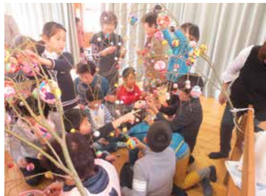
江迎町の繭玉祭りにむけ繭玉製作