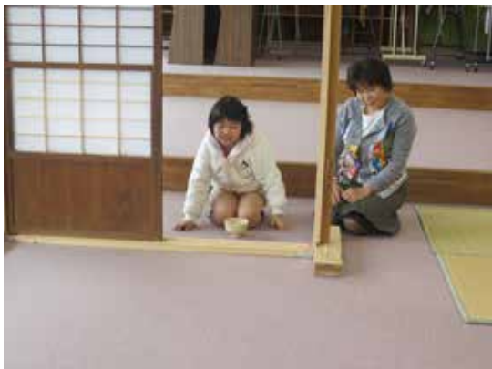
手作りの障子を使ってお茶の練習

コーラスを指導する先生が町で英語を教えている関係で、コーラス教室の中で英単語のカードを使用して発音等を含めて教えてくださっている。また、時には英語の歌に挑戦するなど意欲的に活動している。