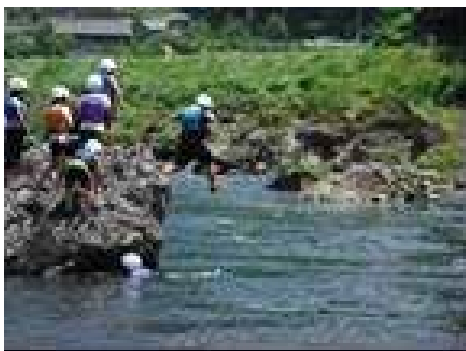
「川遊びを楽しも」のちのち (八幡町)

講師としてお世話になった企業・団体等：(有) EAT&LIVE、NPO 法人メタセコイヤの森の仲間たち、郡上漁業協同組合 施設借用等でお世話になった企業・団体等：郡上八幡自然園、苅安観光ヤナ ※平成 28 年度実績