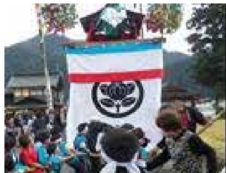
九頭の宮祭見学の曳山体験の様子 (和良町)