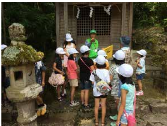
まちなか散策で地域の方から地域の歴史文化について学ぶ

また、20～70 代の様々な年代・職種・立場の「ひと」と交流することにより、家庭と学校だけでは経験できない多様な交流ができ、子供たちの多様性を育む機会となっている。