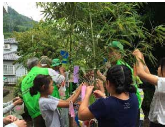
七夕行事で子供たちが切り出した竹に願い事を書いた短冊を飾る