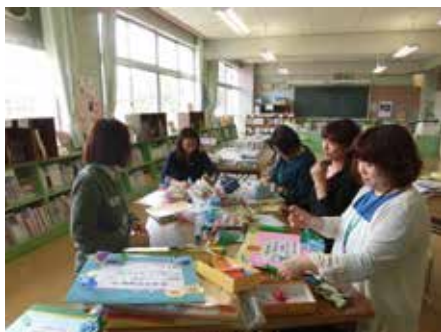
「図書室整備」季節に合った飾りつけ