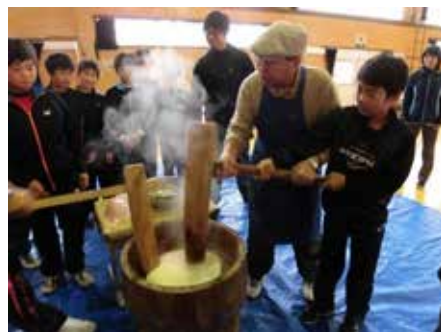
「総合 収穫を祝おう」もちつきの指導