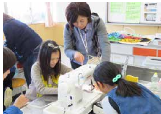
家庭科ボランティアは、ミシン補助の他、手縫いの指導補助や、リサイクルの指導など七月～十一月まで、のべ一四〇名が活動。