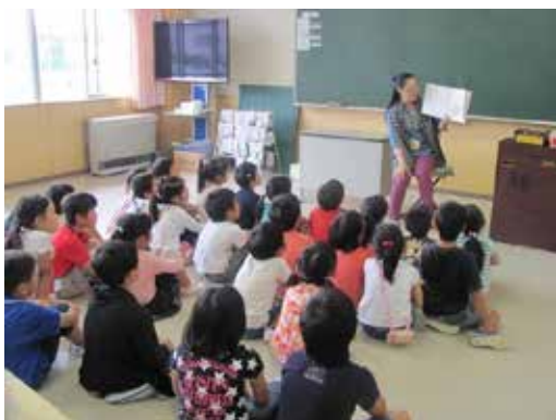
読み聞かせの他、群読やストーリーテリング、ブックトークなどは、サポーターにとってもやりがいのある活動。